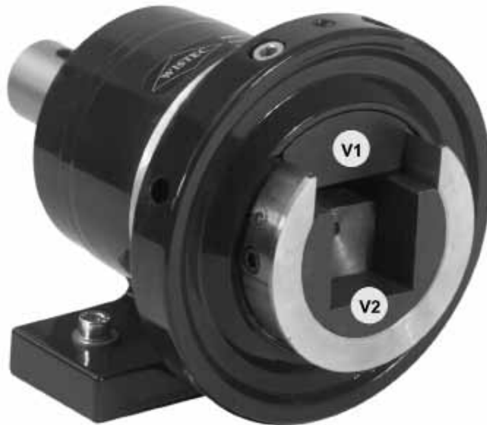
WISTEC Schiebelager, ausgeführt als Stehlager - einseitig mit Wellenzapfen für Antrieb oder Bremse