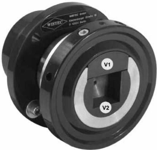
WISTEC Schiebelager in der Flanschausführung für 40 mm Vierkantzapfen

...für eine optimale Drehmomentübertragung von der Maschine zur Wickelwelle. Wir bieten modernste schiebend schließende Lager mit standardisierten Verschleißteilen (V1, V2) an.